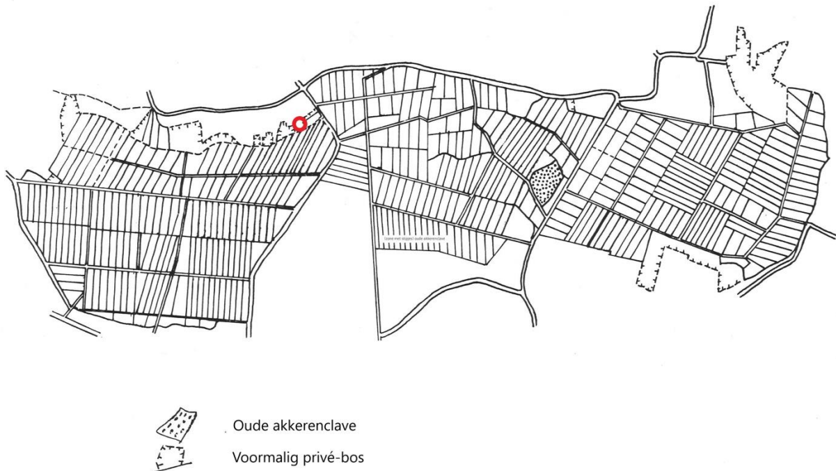
Figuur 5 Plan van de pachtperceeltjes en de exploitatiewegen in het ontgonnen Bos t'Ename, 1851-1868. Den Arie bevindt zich in het rode cirkeltje