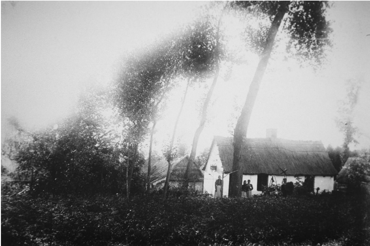
Figuur 3 Zicht op den Arie in 1906

vlechtwerkwallen van de vakwerkhuisjes wellicht werden bestreken 49 . Een foto uit 1906, vermoedelijk van de hand van de befaamde Oudenaardse fotograaf Joseph Remmlinger, toont inderdaad witgekalkte lemen huisjes met een strodak. Ze zijn symmetrisch opgebouwd, consistent met tweewoonsten met een gezamenlijke oppervlakte van 20 m 2 zoals hierboven vermeld 50 .