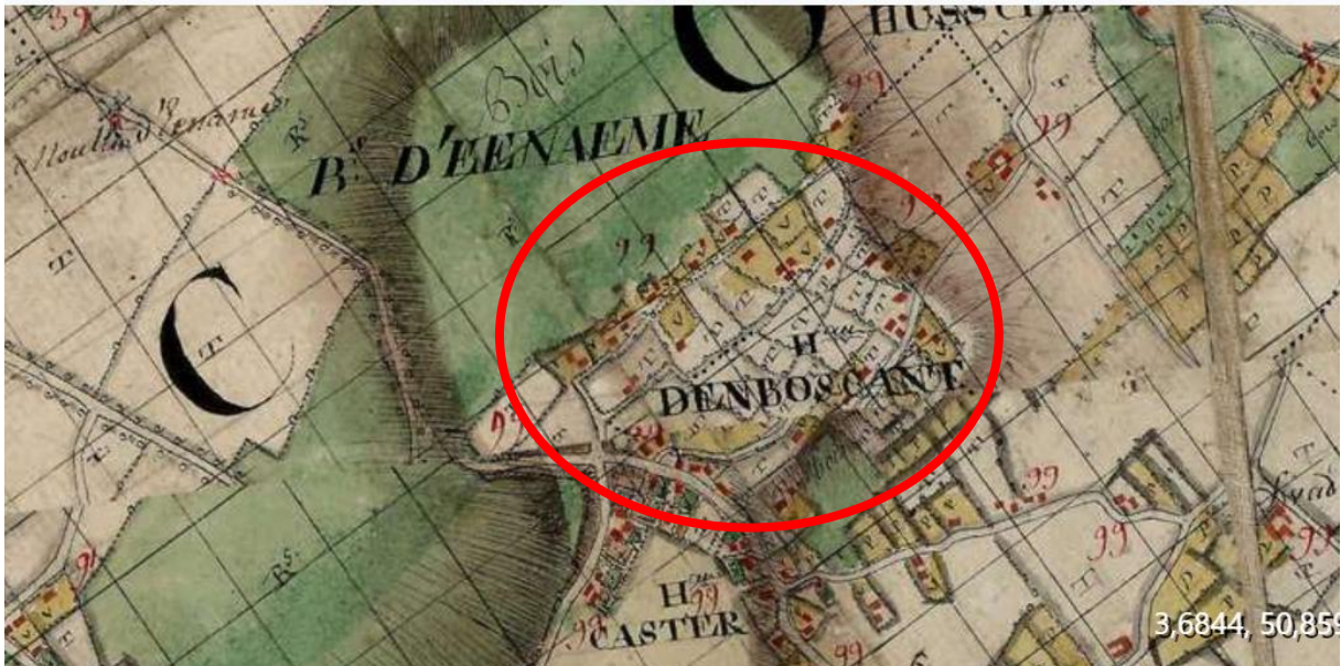
Fig. 1 De Boskant te Mater op de Weense versie van de Ferrariskaart, ca. 1775