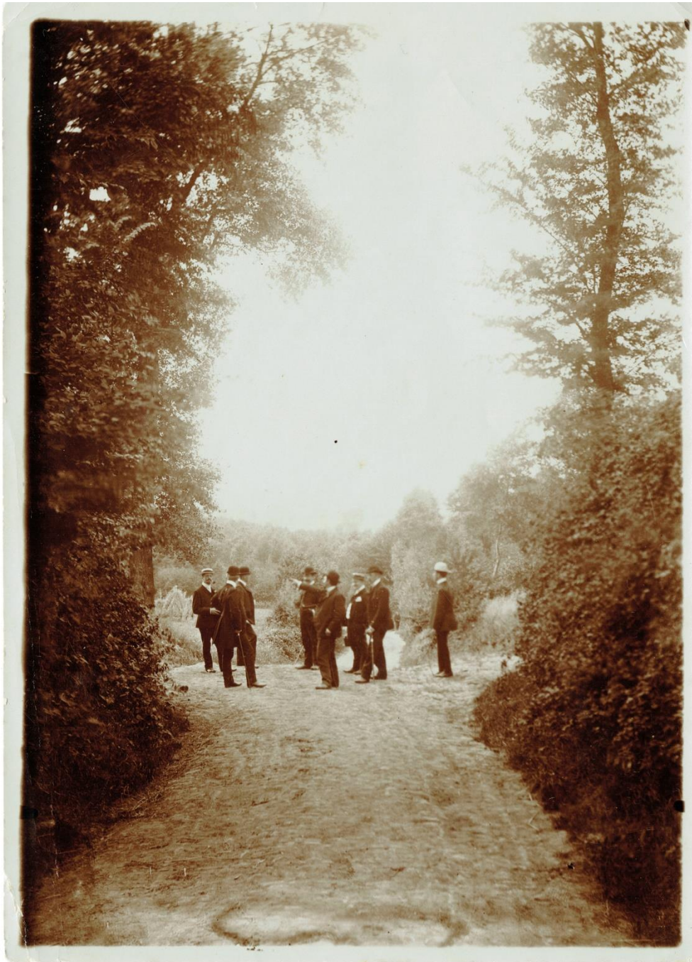
Figuur 7 Foto uit 1906, groepje wandelaars op weg naar den Arie.

Bij onze zegslieden uit het oral history-onderzoek in 1984-1986 (geboren 1892-1921) was het verhaal van wat we hier de "armenkolonie" noemen nog vrij goed gekend, bij die uit het oral history-onderzoek in 2013-2018 (geboren 1923-1941) niet meer of nauwelijks. Ze herinnerden zich enkel nog het latere café. Met deze bijdrage hopen we een kleine bijdrage te leveren aan de geschiedenis van de armenzorg in Vlaanderen tijdens de grote mid-19 e -eeuwse crisisperiode maar ook op plaatselijke schaal dit verhaal te behoeden voor de vergetelheid.