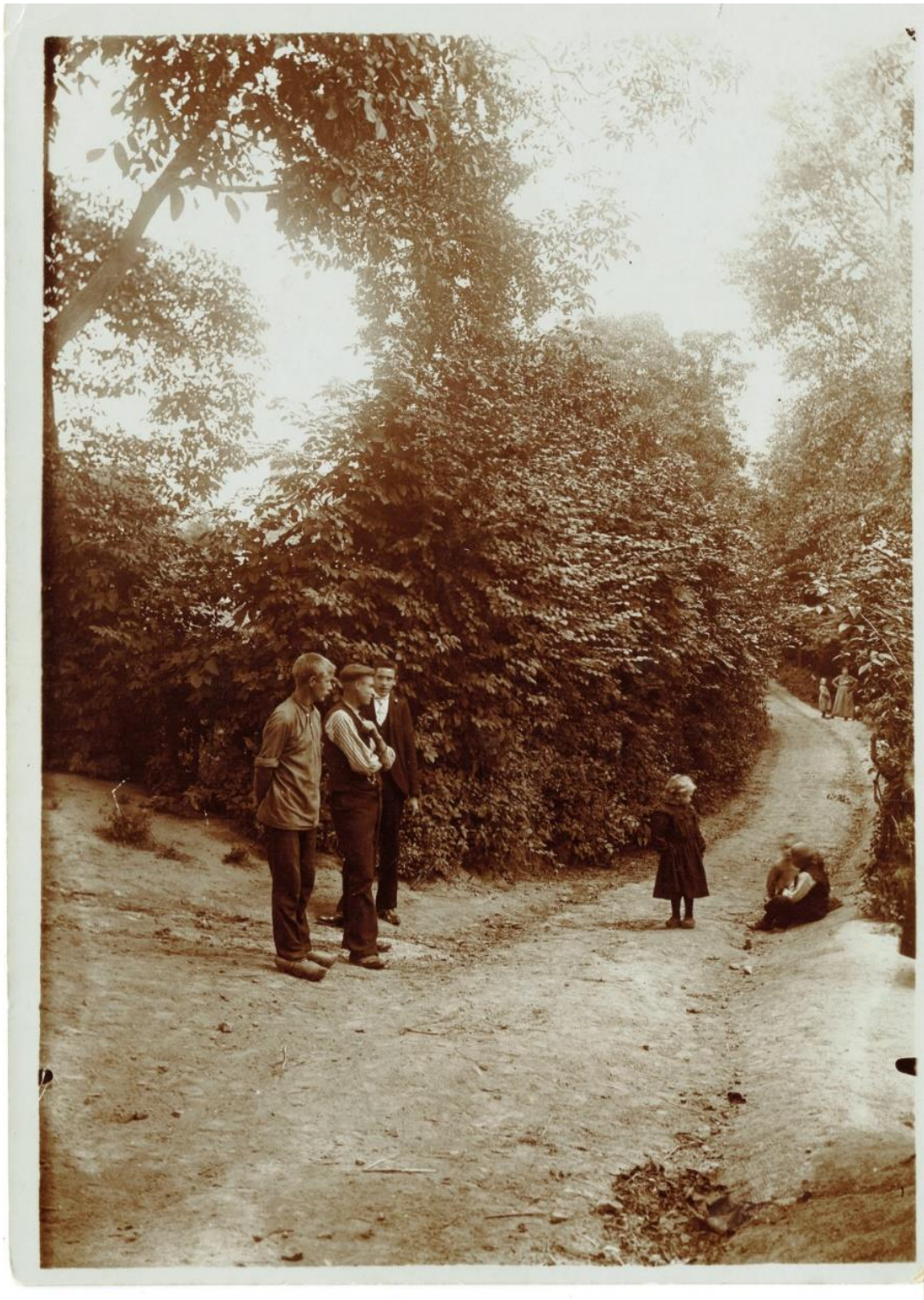
Figuur 6 Foto van de Pontstraete (huidige Boskant) op een zondag namiddag in 1906. Op de achtergrond staat een vrouw met twee kinderen bij de ingang van de losweg die leidt naar den Arie .

In de periode 1867-1920 verlaten 25 bewoners den Arie om buiten Mater te gaan wonen: 12 naar Nederename en Eine, dorpen in de Scheldevallei met beginnende industrialisatie en vraag naar arbeiders, 4 naar Brussel, 3 naar Henegouwen, 2 naar Noord-Frankrijk, 4 naar diverse steden.