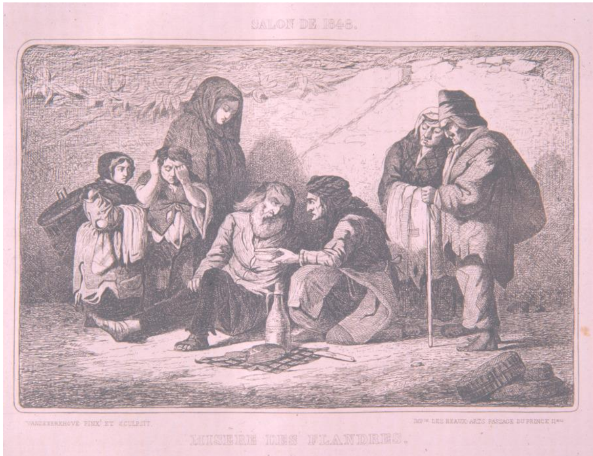
Figuur 2 Prent “La misère des Flandres”, Vandekerckhove 1848

Dezelfde sociaal bewogen commentator in de Gazette schrijft: Intussen doet de ellende in de gemelde gemeenten een verschrikkelijken voortgang, en sleept zy dagelijks nieuwe slachtoffers ten grave niettegenstaende de buitengewoone zachtheid van het jaergetijde. Wij vrezen niet van tegensproken te worden, dat alles, volstrekt alles, hun ontbreekt, dat zy vergaen gelyk de sneeuw voor de zon, en dat zich reeds een gevaerlyke ziekte onder hen begint te verklaeren, welke ziekte alleen aen het gebrek van voedsel moet worden toegeschreven 22 .