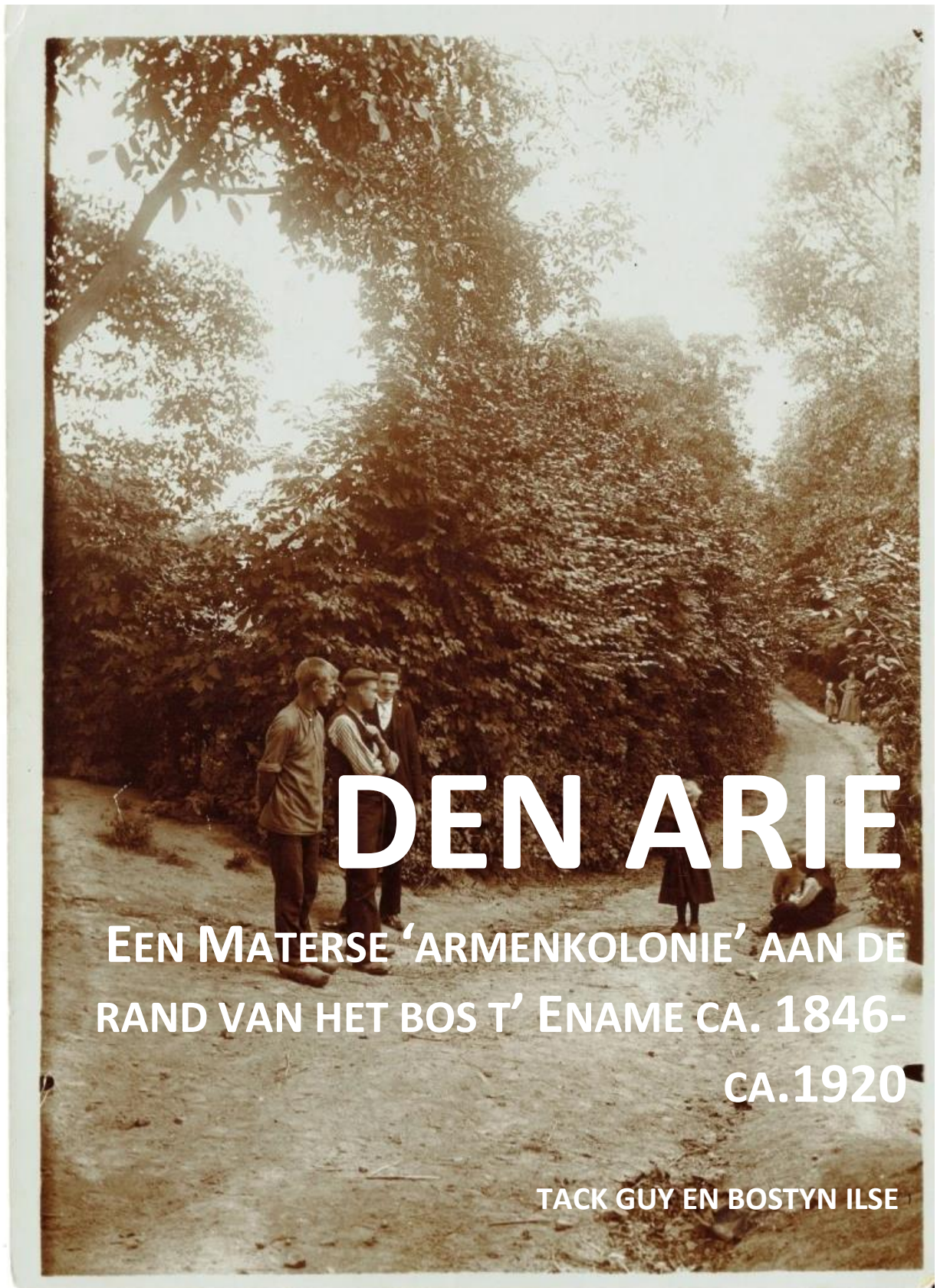
Figuur 6: Foto van de Pontstraete (huidige Boskant) op een zondagnamiddag in 1906. Op de achtergrond staat een vrouw met twee kinderen bij de ingang van de losweg die leidt naar den arie.